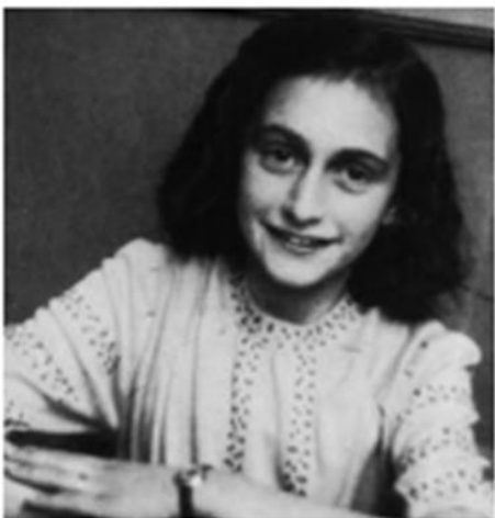
Figura 1: Anne Frank Creative Commons by Chuck Ayoub Disponível em: https://sites.google.com/site/nliberyeba/est/process/anne-frank Acesso em 18 de outubro de 2016.